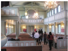
Ausflug zur Birkenes Kirche