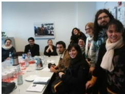
Teilnehmer des zweiten Pilotkurses beim Besuch des DRKs (Deutsches Rotes Kreuz)