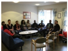
Beim Besuch des lokalen Gesundheitszentrum