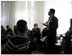
F.V. während seiner Präsentation als Botschafter für Dienstleistungen

Zudem fand F.V. die Möglichkeit sich innerhalb des Kurses mit Dienstleistenden zu beschäftigen sehr hilfreich. So konnte er ein Grundverständnis entwickeln wo die Berufe herkommen. Dadurch haben sich nicht nur seine Leistung effektiver zu kommunizieren verbessert sondern auch aus die ihm gebotenen Möglichkeiten Nutzen zu ziehen.