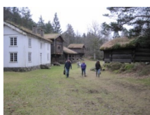
Besichtigung alter Gebäude in einem Open-Air Museum